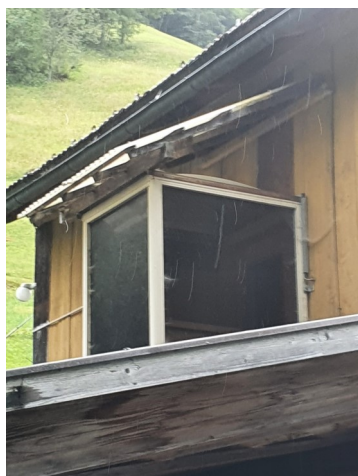
Der revisionsbedürftige Lift