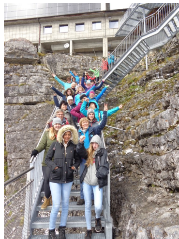
Zwischenhalt auf Station Birg und Thrill Walk...