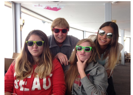
Mittagessen im Drehrestaurant Piz Gloria. Woo bleibt die Sonne??