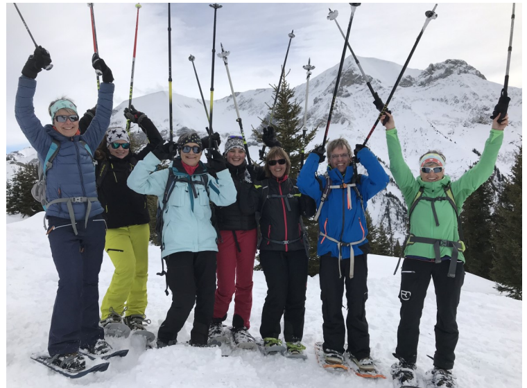
Gipfel erreicht :-)

Rechts im Hintergrund der Dreispitz. Dieser Gipfel soll auf Wunsch der Teilnehmenden im Sommer in Angriff genommen werden. Wer kommt sonst noch mit? Tour-Ausschreibung folgt.