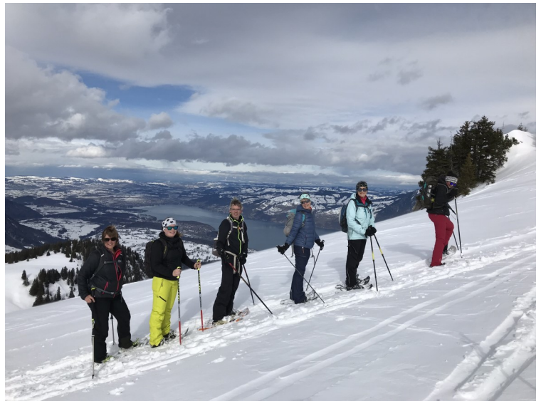
Kurz vor dem Gipfel, im Hintergrund der Thunersee.